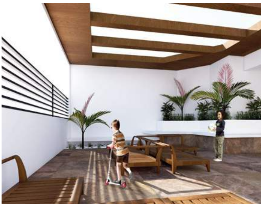
ÁREA COMÚN CON TERRAZA