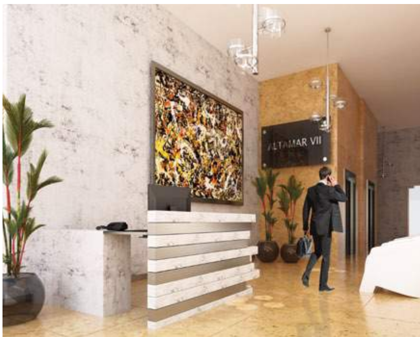
AMPLIO LOBBY DE ACCESO